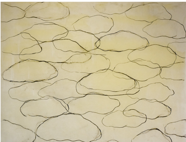
Béatrice Pontacq, Nuages et vides I 126 x 150 cm, papier, huile et fusain 2019