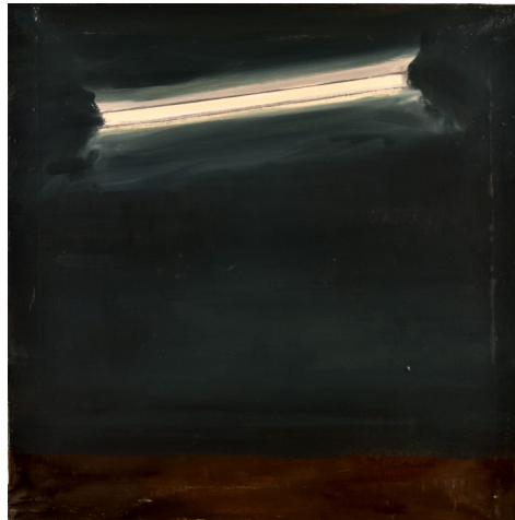
Axel Ingé, Lampe 22 50 x 50 cm, huile sur toile 2019