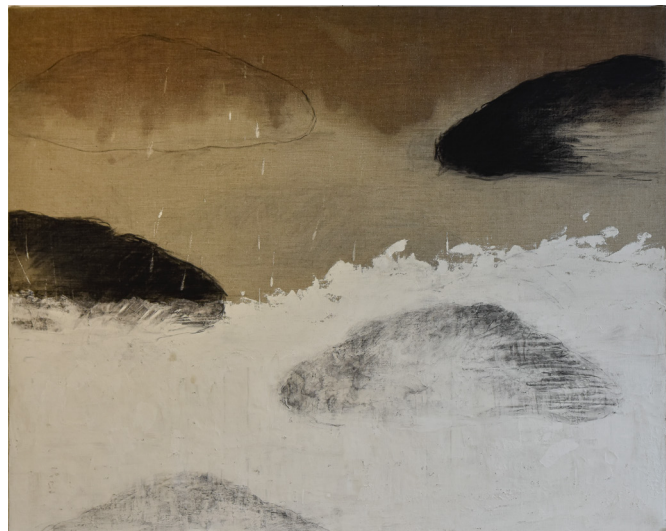
Béatrice Pontacq, Nuages noirs sur lin et argile 130 x 160 cm, huile, fusain, argile sur toile de lin 2019